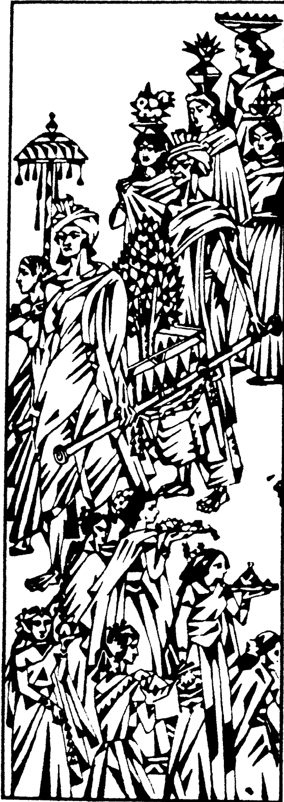
বাকরোপা উৎসব নন্দলাল বসু - কৃত