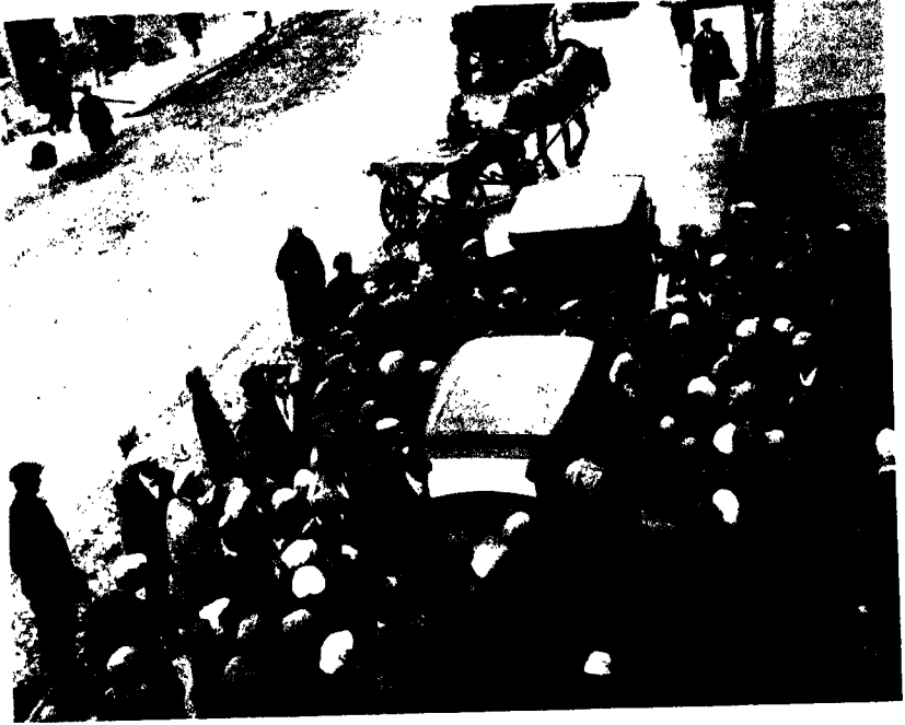
রবীন্দ্রচিত্রপ্রদর্শনীতে কবির আগমন