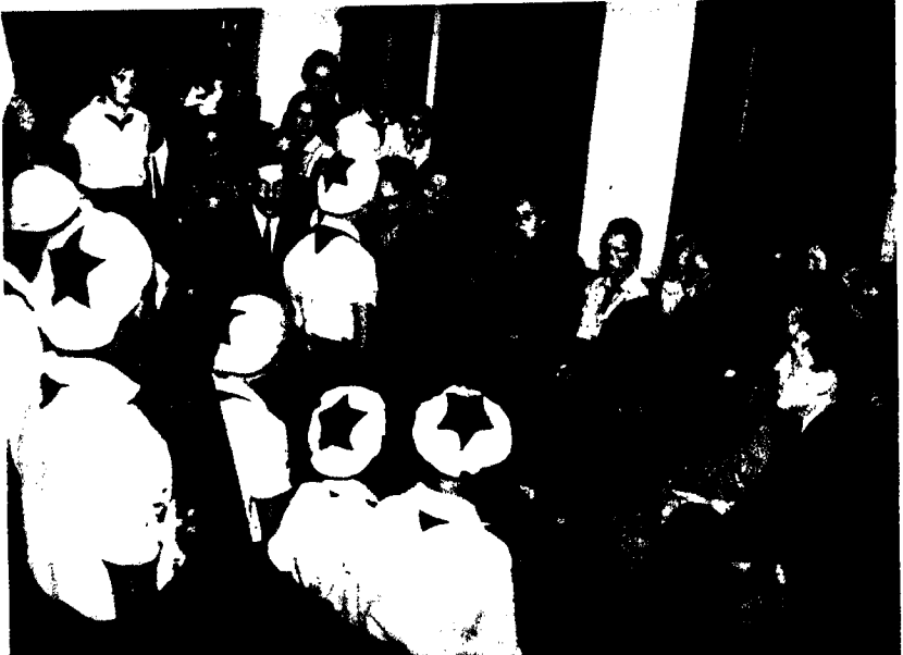
পায়োনায়র্স্ কমান্ডে আলাপ-আলোচনা