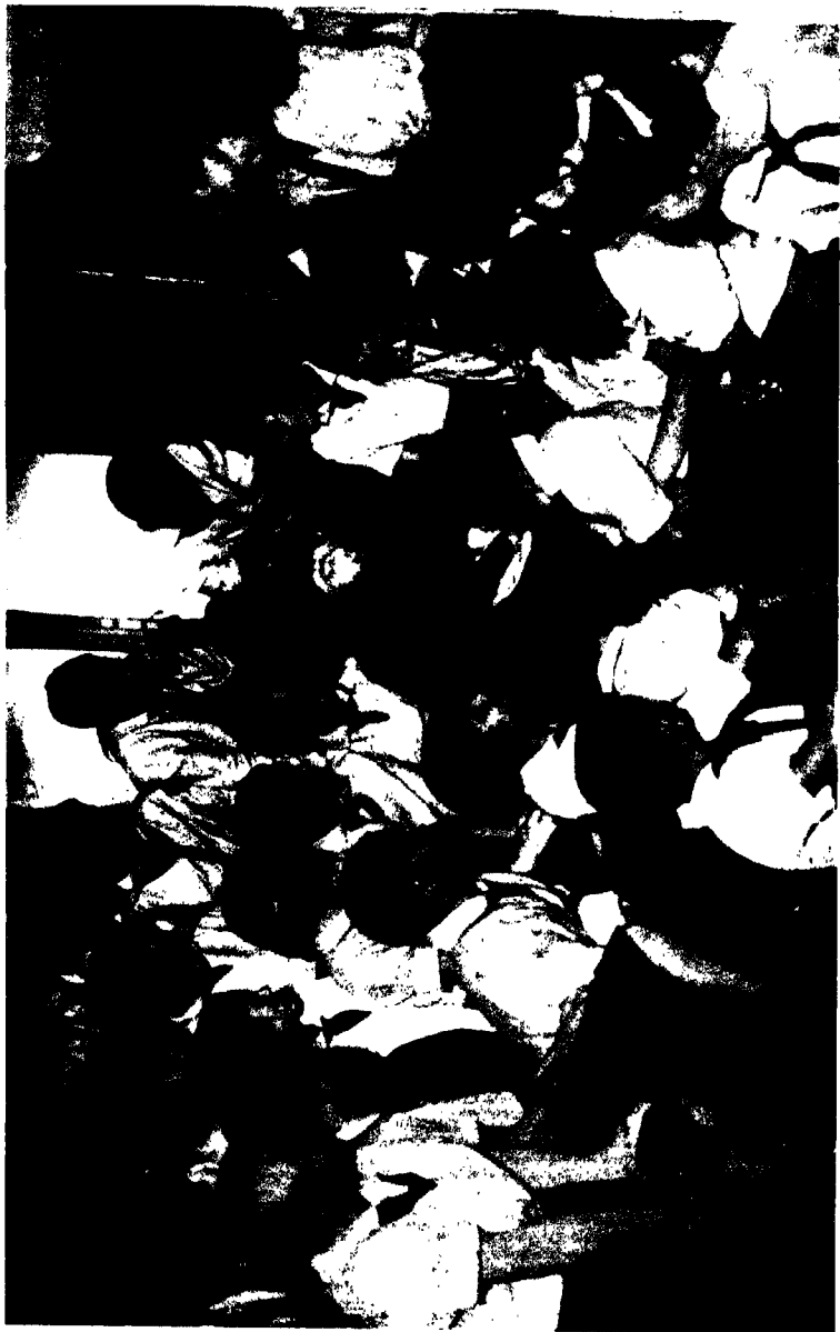
পায়েনিয়র ছাত্রছাত্রীগণকৃতক রবীন্দ্রনাথের সংবর্ধনা