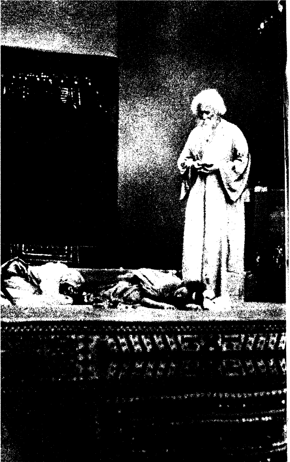
নটীর পূজা : উপালি-বেশে রবীন্দ্রনাথ