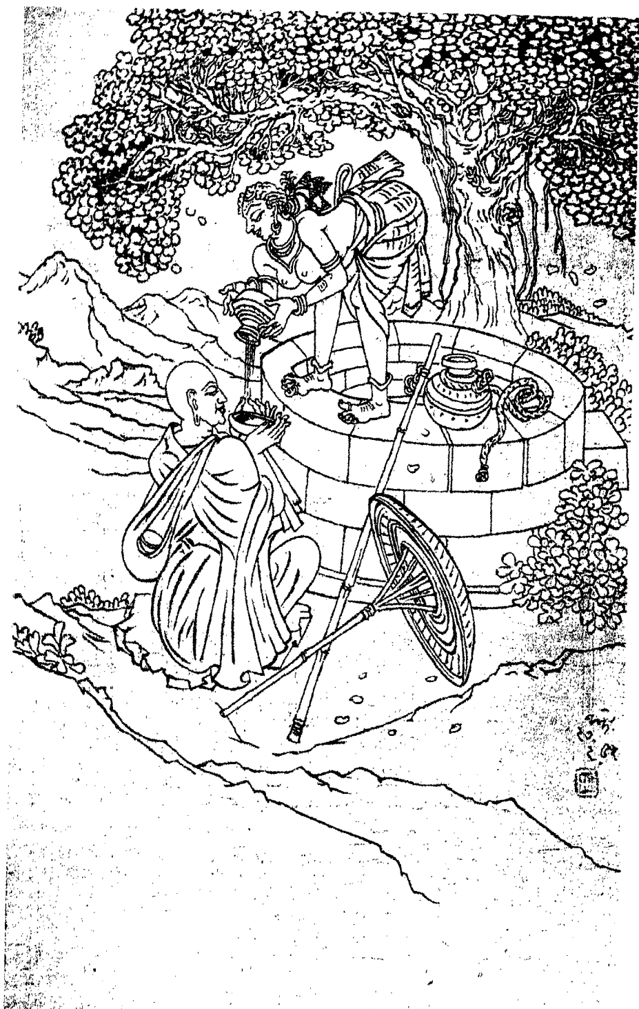
চণ্ডালিকা : প্রকৃতি ও আনন্দ নন্দলাল বসু-অঙ্কিত